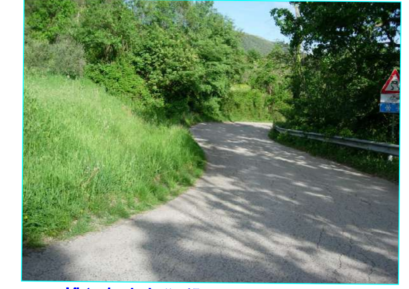
Vista da picchetto 15