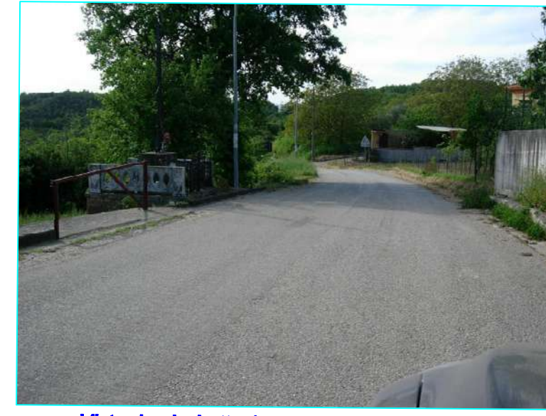
Vista da picchetto 1