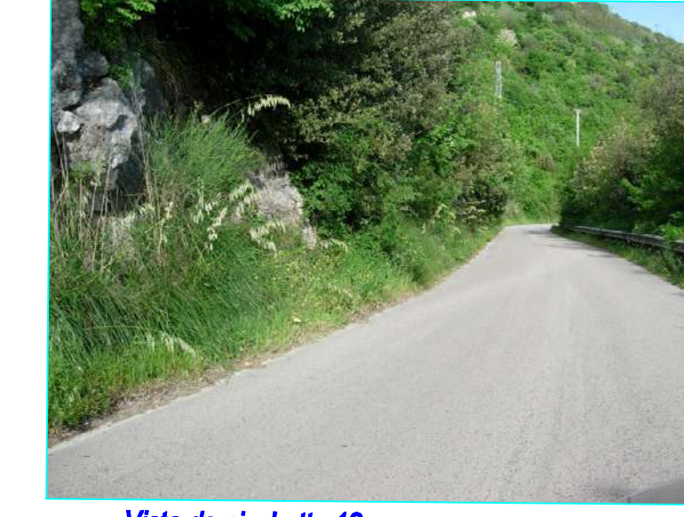
Vista da picchetto 12