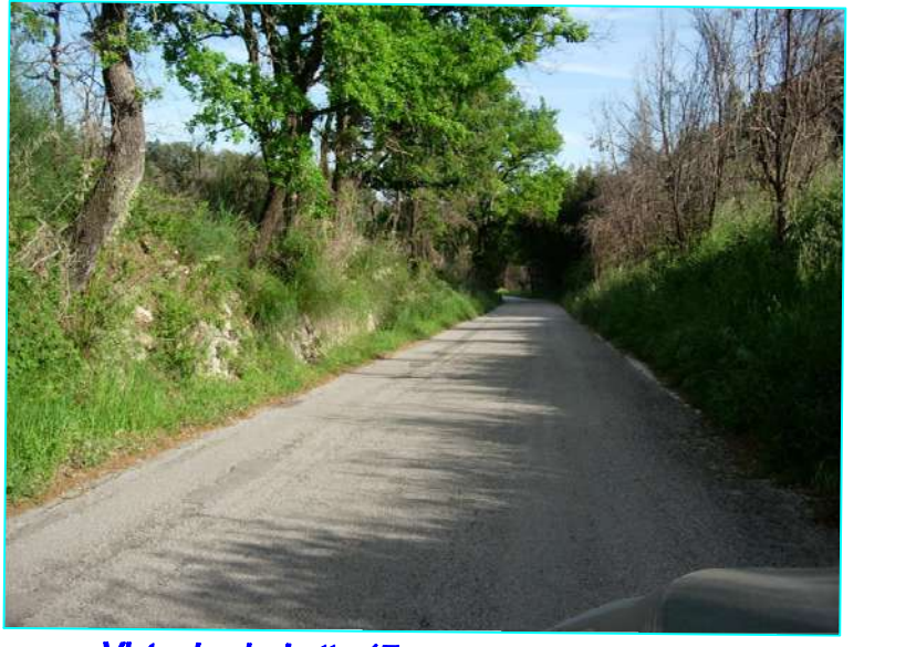
Vista da picchetto 17