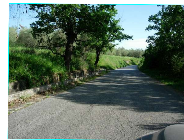
Vista da picchetto 27