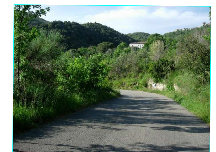
Vista da picchetto 31