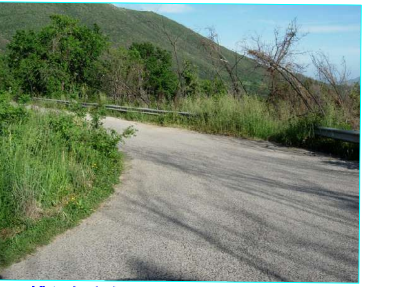
Vista da picchetto 21