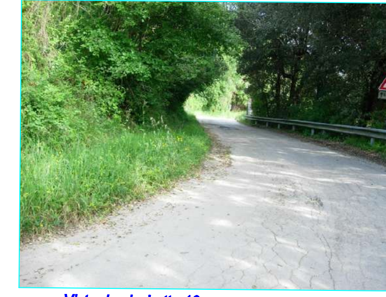
Vista da picchetto 10