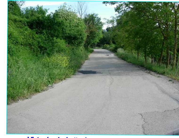
Vista da picchetto 4