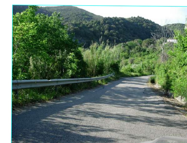
Vista da picchetto 30