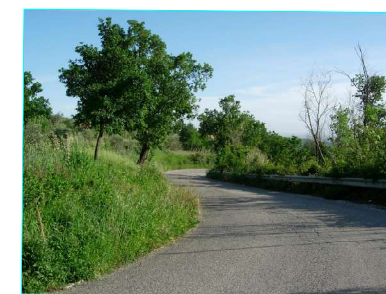
Vista da picchetto 29