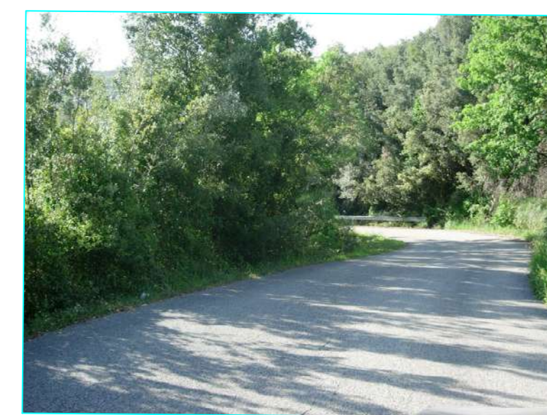
Vista da picchetto 23