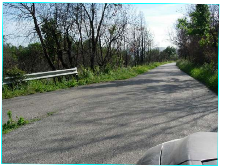
Vista da picchetto 19